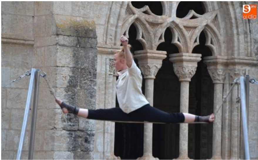
"Wasteland" de Cirque Barbette

CIUDAD RODRIGO | Por su parte, la fachada del Palacio de Montarco se usó como gran lienzo en la obra 'Tandem'